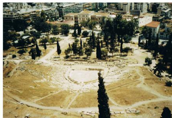
Rysunek 8: Teatr Dionizosa: Jest to najsłynniejszy teatr grecki (zaprojektowany na 30 tys. widzów). Został wybudowany w Atenach u stóp Akropolu. Kształt być może wywodzi się od miejsca pierwotnych spotkań koło świątyni Dionizosa w Atenach. Na początku V w. p.n.e. zainstalowano tu drewniane ławy, a skene była prowizorycznym barakiem.