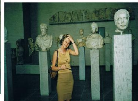
Rysunek 3: Fragmenty rzeźb z Akropolu: częściowo zachowane popiersia i rzeźby znajdujące się w wystroju celi Akropolu, Niemcy, Monachium, Alte Pinakothek

są to figury z tympanonu na Partenonie, chodzi o zdobienia w tym trójkącie znajdujące się nad szeregiem kolumn, jakby w sklepieniu dachu. Na zdjęciu prezentowane odlewy gipsowe, oryginał nie wystawiony. Niemcy, Monachium, Alte Pinakothek