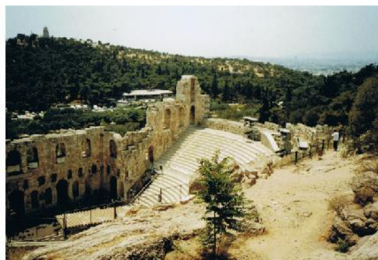
Rysunek 7: Odeon Heroda Attyka – odeon w Atenach, uważany za największy i najwspanialszy z odeonów starożytnych. Zbudowany został na południowo-zachodnim stoku Akropolu ateńskiego w 161 r. p.n.e. przez Heroda Attyka, który w ten sposób uczcił pamięć ukochanej małżonki, Aspazji Regilli.