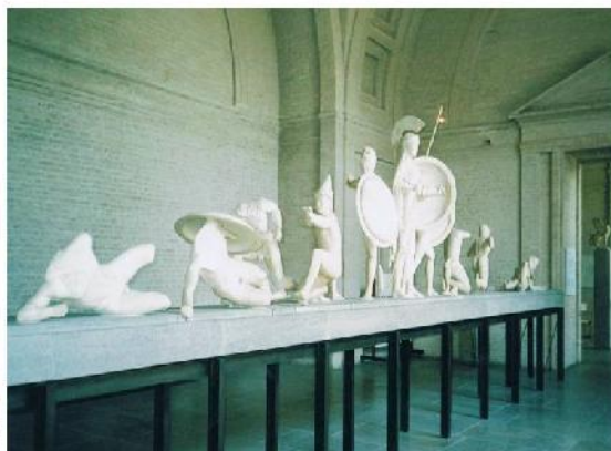
Rysunek 2 Figury z tympanonu:

są to figury z tympanonu na Partenonie, chodzi o zdobienia w tym trójkącie znajdujące się nad szeregiem kolumn, jakby w sklepieniu dachu. Na zdjęciu prezentowane odlewy gipsowe, oryginał nie wystawiony. Niemcy, Monachium, Alte Pinakothek