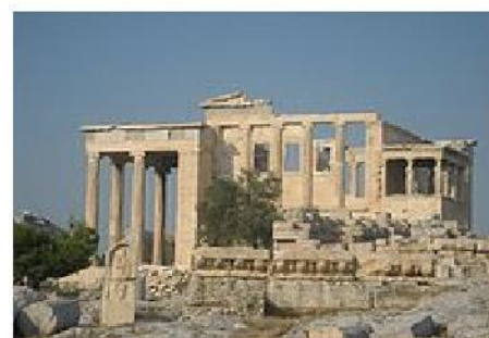
Rysunek 6: Erechtejon: widok z drugiej strony.