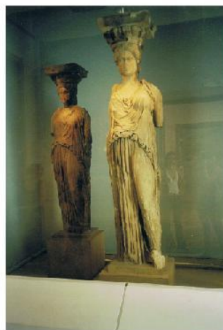
Rysunek 5: Kariatyda: podpora w kształcie kobiety, często wykorzystywana w porządku jońskim. Ekspozycja na zdjęciu znajdują się w muzeum na Akropolu, Grecja, Ateny