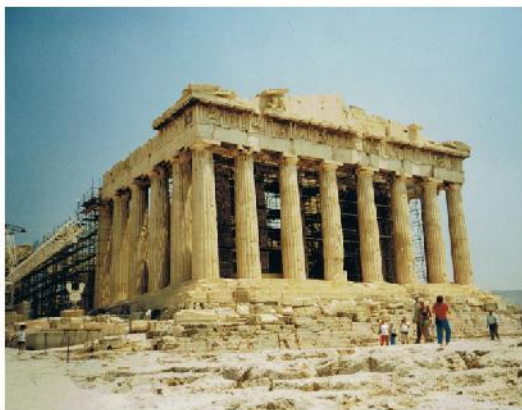
Rysunek 1 Partenon: świątynia na greckim Akropolu, wykonana w większości w stylu doryckim. Grecja, Ateny