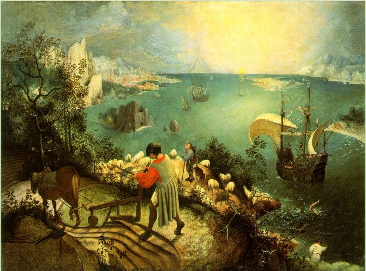
Rys. 1 – Pieter Bruegel „Krajobraz z upadkiem Ikara”